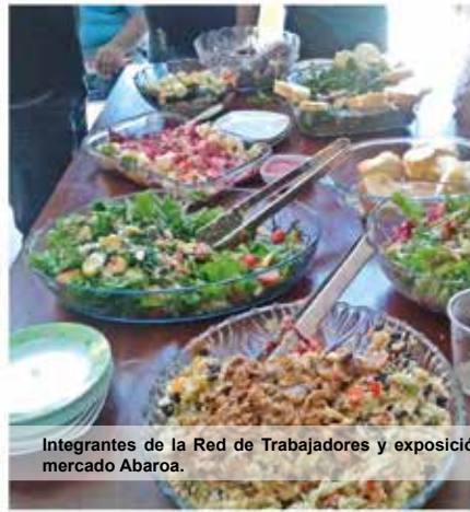
Integrantes de la Red de Trabajadores y exposición de productos en el puesto del mercado Abaroa.

nizamos, con el objetivo principal de mejorar nuestras capacidades y ofrecer productos de calidad a la población en Tarija, por eso la invitación para quien lee esta nota, si requiere de los servicios que ofrecemos, visítenos en nuestro puesto de exposición y venta en el segundo piso del mercado Abaroa