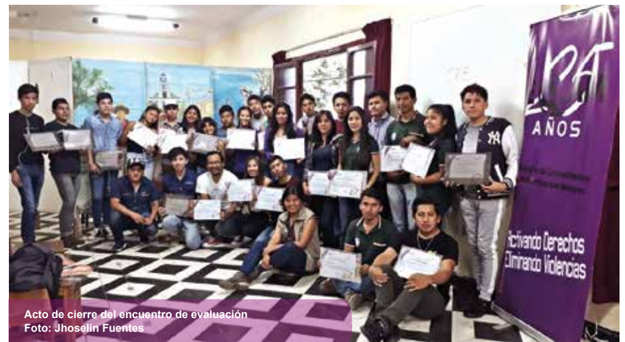
Acto de cierre del encuentro de evaluación

cargado de mucha energía, culminó con un positivo “Juntas y Juntos, estamos Cambiando Nuestra Realidad” y la entrega de certificados por la participación activa dentro de los procesos de formación y en los cuales y las y los participantes se