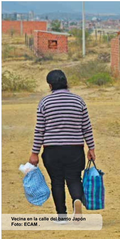
Vecina en la calle del barrio Japón

Por: Roxana Solís, comunicadora popular-