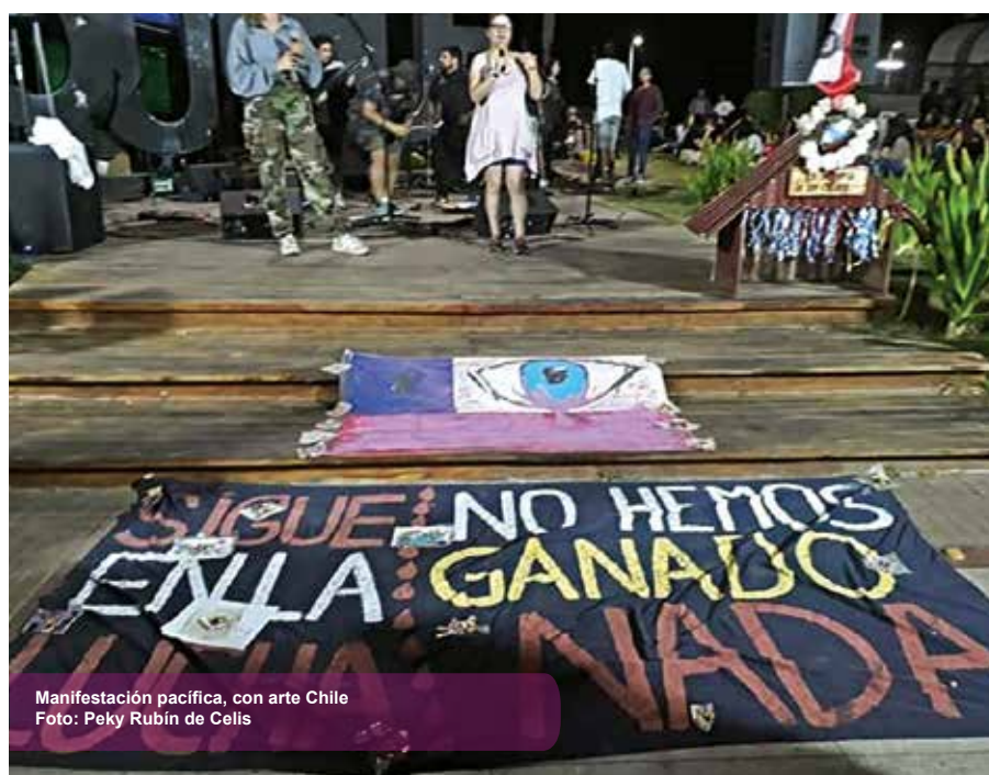
Manifestación pacífica, con arte Chile

“Que quieren exponer su música de contingencia en este escenario que tenemos, que nosotros nos tomamos, estas letras negras expresan nuestro luto porque consideramos que si hay hermanos en este país, hermanas en este país que están sufriendo, estamos de luto hasta que esto se termine hasta que nuestro gobierno entienda nuestras necesidades y nos cumpla, vamos a seguir de luto con estas manifestaciones, por nuestros hermanos detenidos, torturados, baleados, mujeres asesinadas, no podemos festejar, esta es nuestra manifestación lo hacemos