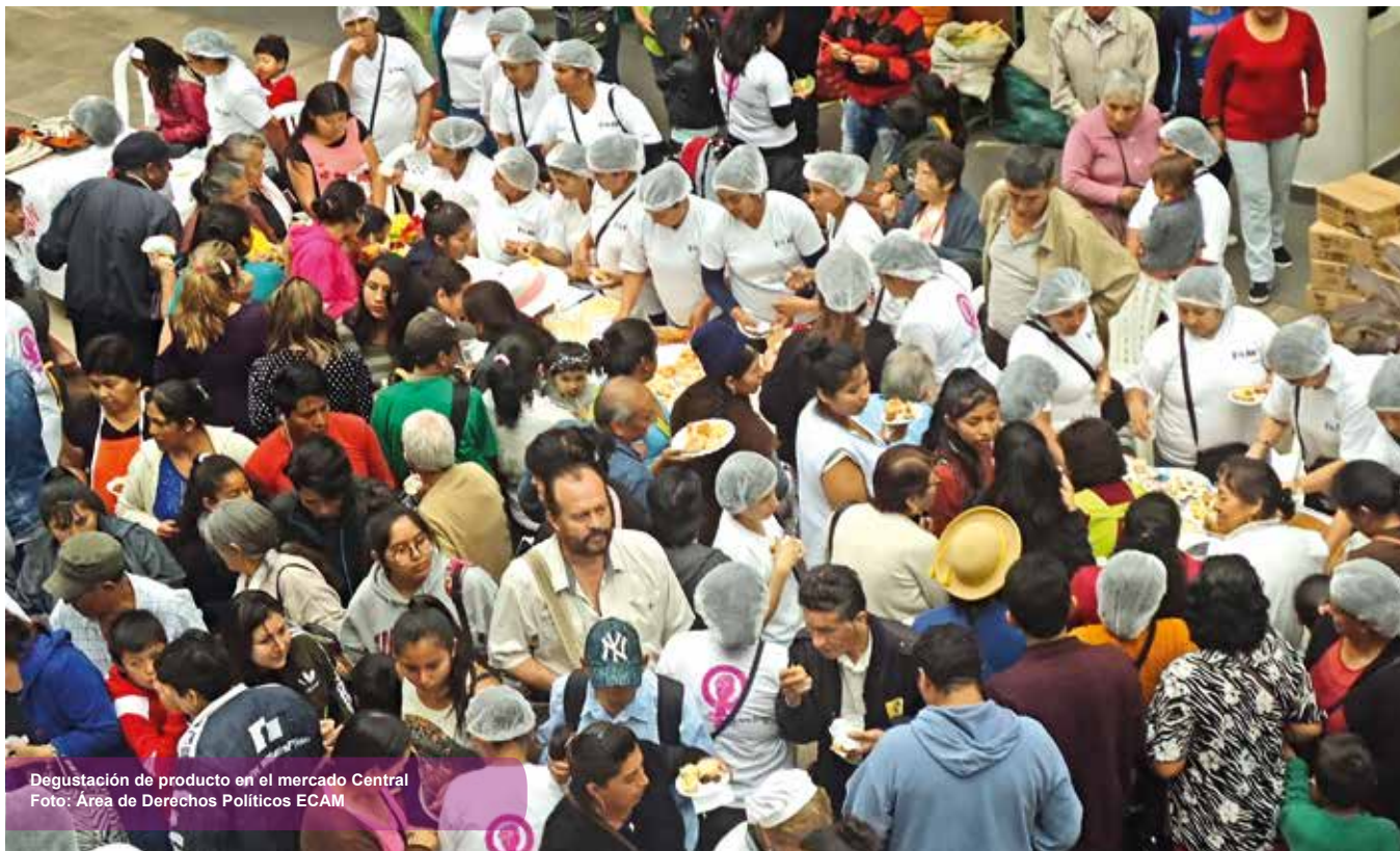
Degustación de producto en el mercado Central

El patio del mercado Central de la ciudad de Tarija, ha sido el punto de encuentro donde mujeres productoras del área urbana y rural de la provin-