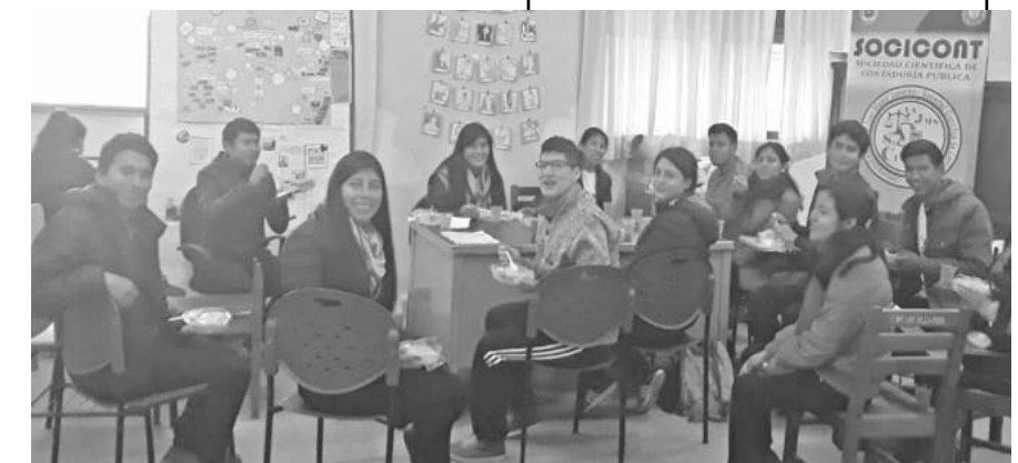
Integrantes del SOCICONT

los espacios en las áreas verdes y de equipamiento, lo que falta es que los proyectos se hagan realidad con la inversión de recursos; por ello la vecindad pide a las autoridades del municipio, la gobernación y gobierno nacional prestar la atención a las necesidades del barrio, sobre todo para que lleguen los servicios básicos, agua y alcantarillado, que son un derecho humano de acuerdo a la Constitución Política del Estado. También se exige a las autoridades llamadas por ley, concejo municipal, asamblea legislativa departamental y brigada parlamentaria de Tarija, cumplir el rol que les corresponde de fiscalizar, legislar y hacer una buena gestión pública de manera que la vecindad en, Las Retamas, mejore sus condiciones de vida.