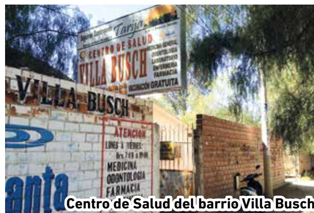
Centro de Salud del barrio Villa Busch

como ser óvulos, cremas u otros durante 48 horas antes.