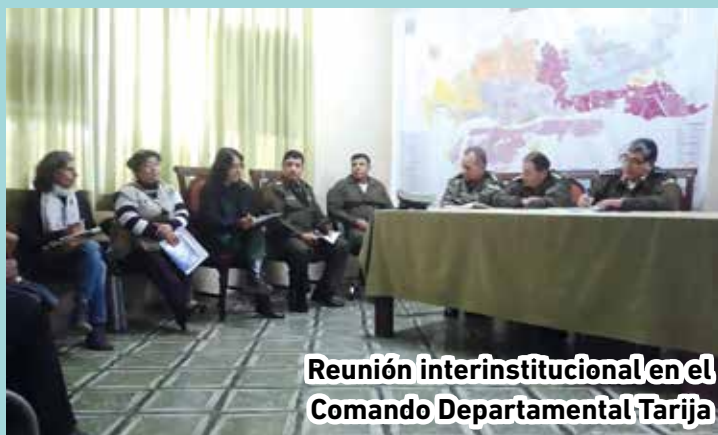
Reunión interinstitucional en el Comando Departamental Tarija

Con el objetivo de coordinar y desarrollar un plan de acción para proteger a niños, niñas