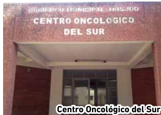
Centro Oncológico del Sur

Las drogas oncológicas, en si el tratamiento de esta enfermedad es carísimo y por ende es uno de los impactos más relevante que tienen las mujeres que padecen de ella, es digno ponderar la labor social y desinteresada de