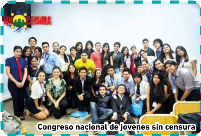
Congreso nacional de jóvenes sin censura