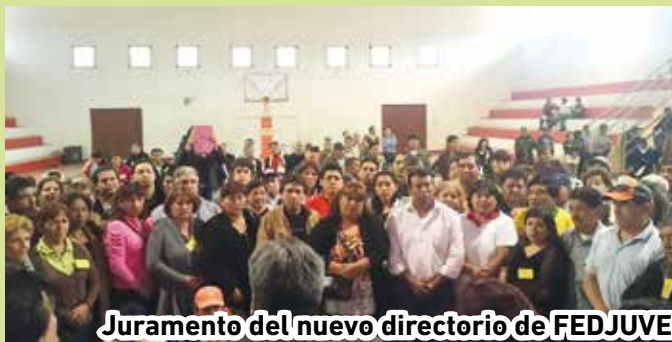
Juramento del nuevo directorio de FEDJUVE

En el desarrollo del Congreso vecinas y vecinos pidieron la suspensión,