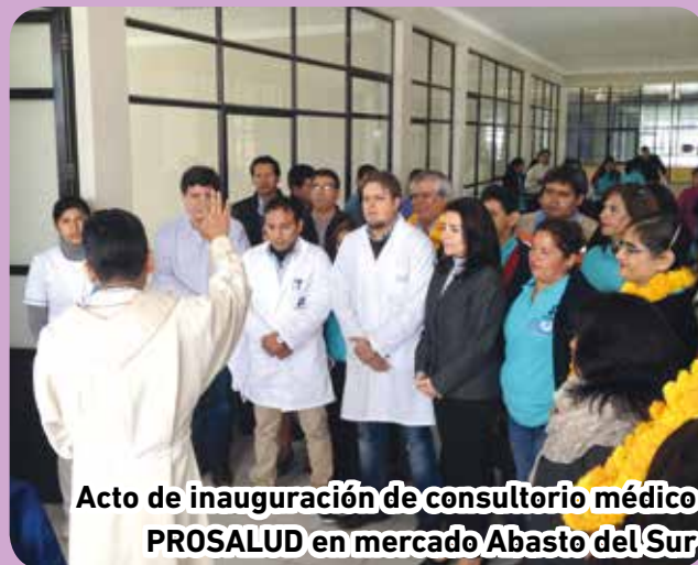
Acto de inauguración de consultorio médico PROSALUD en mercado Abasto del Sur