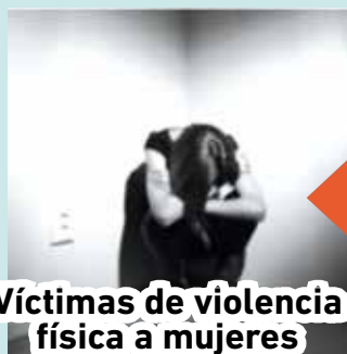
Víctimas de violencia física a mujeres adultas

MÁS DE LA MITAD DE NOTICIAS REFERIDAS A LAS MUJERES LAS CONSIDERA VÍCTIMAS.